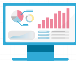
透析ノート (クラウドサービス)